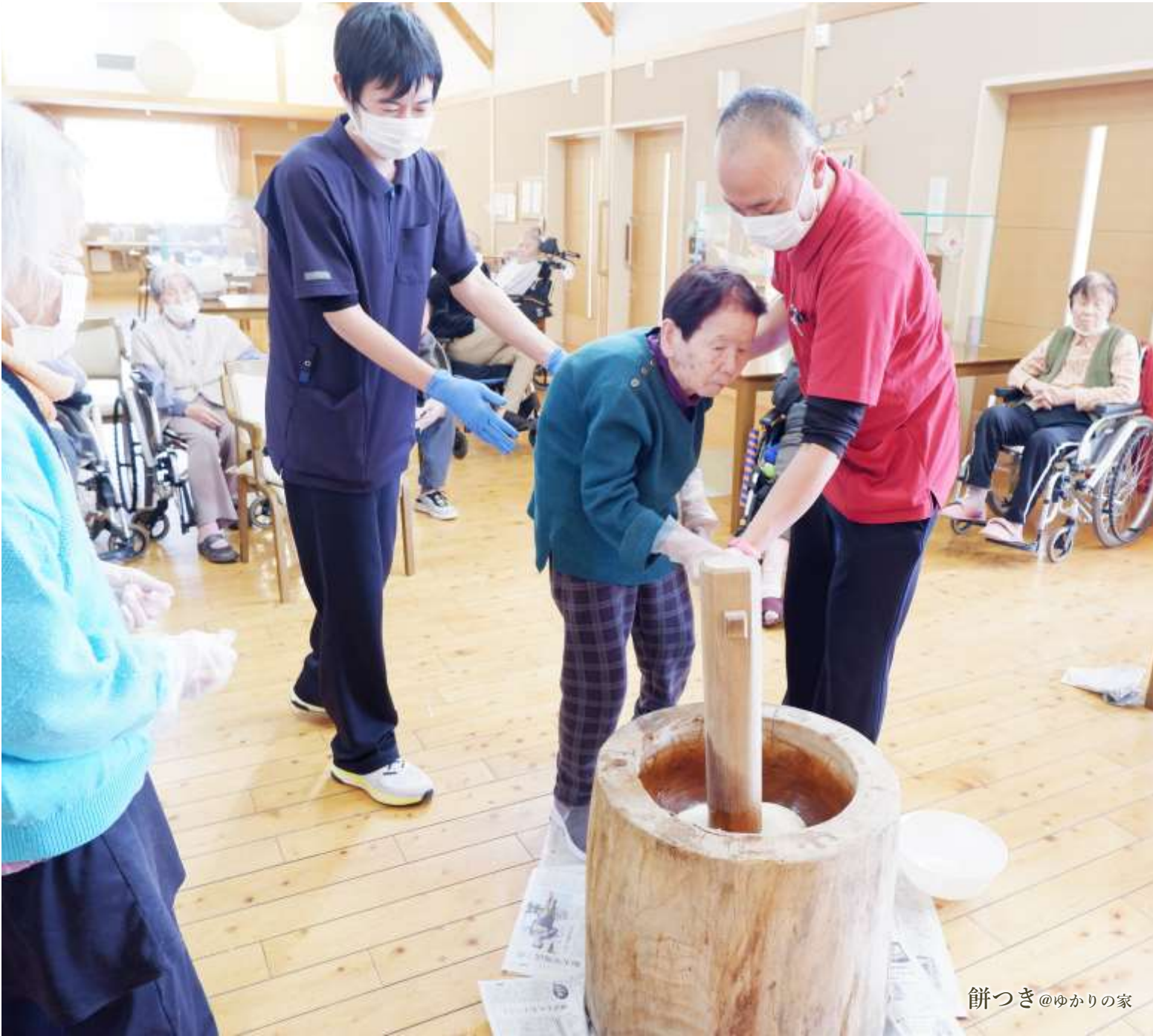
餅つき @ゆかりの家