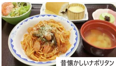
昔懐かしいナポリタン