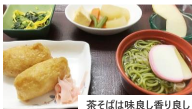
茶そばは味よし香りよし