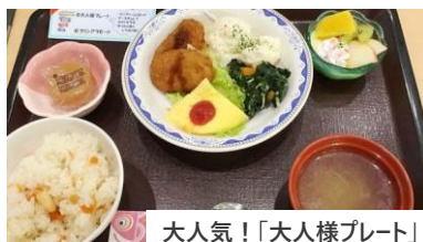
大人気!「大人様プレート」

昭和の日・八十八夜・こどもの日など、GWもイベント盛りだくさん! 鯉のぼりも迫力満点です!