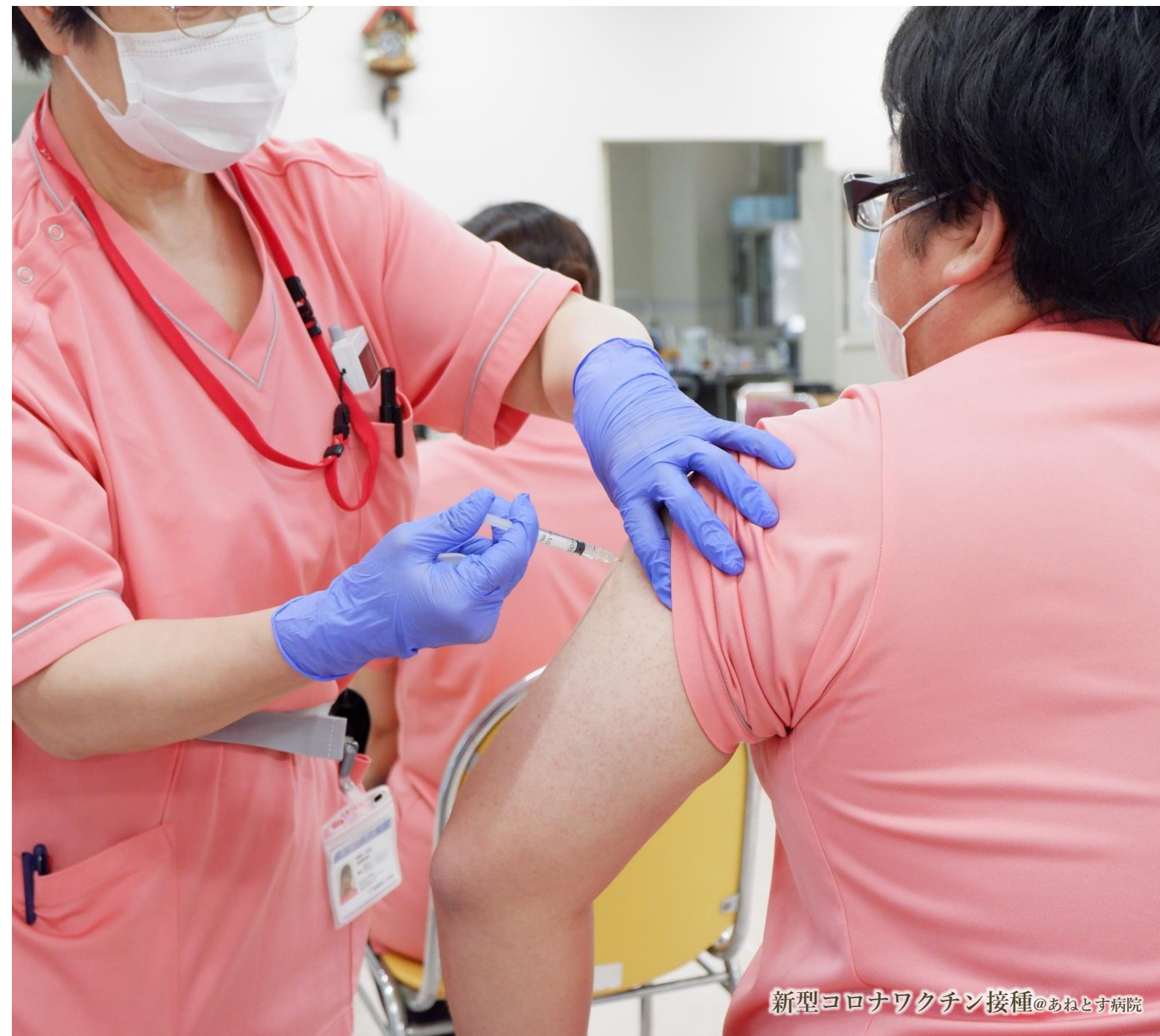
新型コロナワクチン接種@あねとす病院